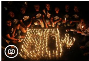
Fotogalería | Las principales ciudades celebran la Hora del Planeta

14. Traduceți în limba română următoarele trei titluri din cotidianul El pais (Spania):