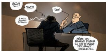
Armes chimiques : comment les espions français et israéliens ont manipulé un ingénieur syrien

15. Traduceți în limba română următoarele trei titluri din Le Monde (Franța):