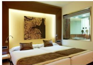
Detenido un hombre que durmió en 13 hoteles de lujo y se fue sin pagar