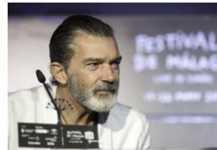
Banderas: "Sufrió un ataque al corazón el 26 de enero"

15. Traduceți în limba română următoarele trei titluri din Le Monde (Franța):