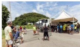
Guyane : les syndicats votent la grève générale à compter de lundi