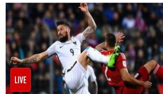
Football : la France reprend l'avantage face au Luxembourg (2-1) LIVE